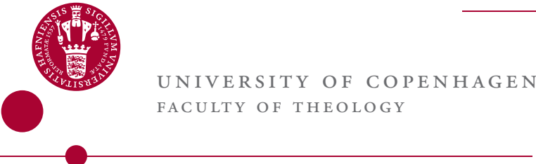
Horizontal version with logo to the right

UNIVERSITY OF COPENHAGEN FACULTY OF THEOLOGY